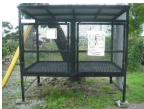
町内のごみステーション

なお、役場や出張所では転入手続きの時に、転入先の町内会名と連絡先をお知らせしていますので、よろしくお願いいたします。