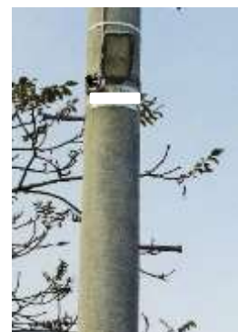
町内の 防犯灯・街路灯