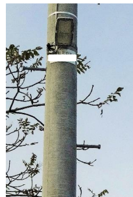
町内の 防犯灯・街路灯

なお、役場や出張所では転入手続きの時に、転入先の町内会名と連絡先をお知らせしておりますので、よろしくお願いいたします。