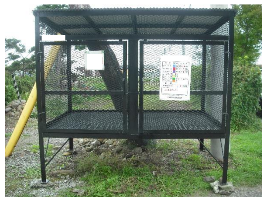
町内のごみステーション